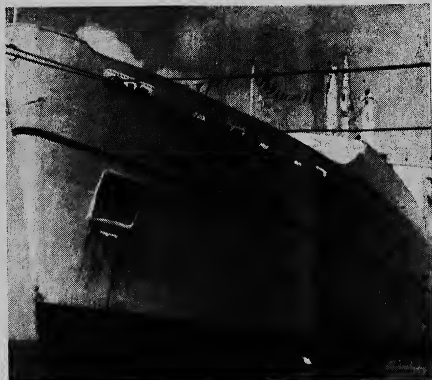
„Empress of England“, bapor di turista di Canadian Pacific Line y di cual S. E. L. Meduro & Sons (Aruba) N.V. ta agente local a drenta haf diadomingo mainta cu 650 turistas.